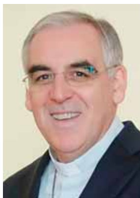
✠ Arcivescovo Lauro Tisi